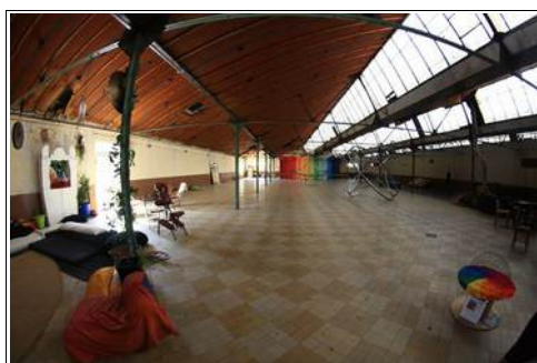
La salle pluridisciplin'R

Par son rachat, cette coopérative mutualisée deviendra un Bien Commun au service d'un art et d'un artisanat vivant.