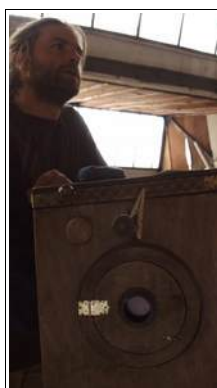
Photographie par procédés anciens avec Mickaël