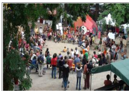
La Foire à l'Autogestion du Gard