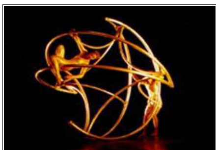
Zigrolling Cie avec Toni