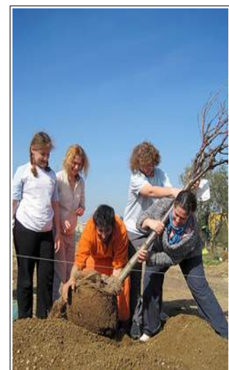
Chantiers solidaires et Jardins partagées en Cévennes