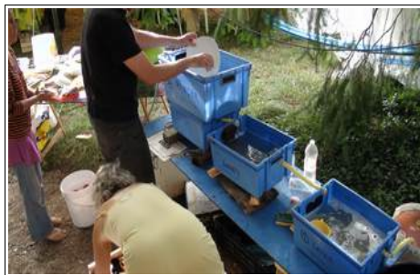
Station de lavage vaisselle à économie d'eau