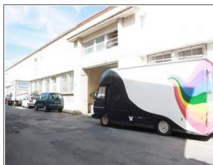
vue de devant