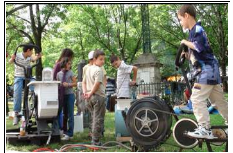
Laverie à pédales