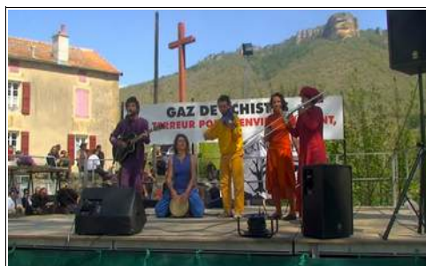
Musique avec "les Guerriers de l'Arc-en-Ciel"