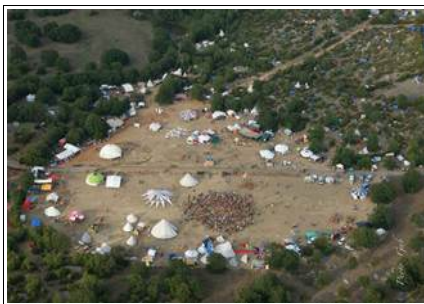
Le Souffle du Rêve 2013

Pourtant le point noir qui revient à chaque fois est la question du terrain qui reçoit le rassemblement. Soit nous en revenons à des locations qui font augmenter le prix de revient de l'évènement, soit des accords sont trouvés avec des propriétaires privés, mais à chaque fois, nous restons dépendants de leur bon vouloir et cela ne facilite en général pas la tâche.