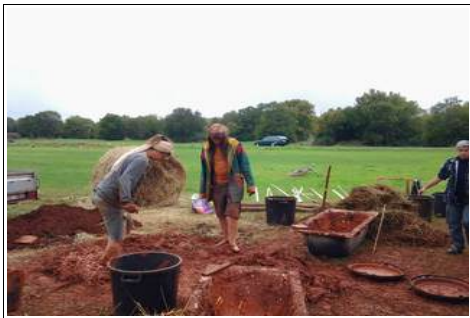
Chantier Paillourte au Souffle 2013

Et ce sera un plaisir que d'organiser des chantiers collectifs et des ateliers d'auto-constructions car ces œuvres communes deviendront de réels acquis .