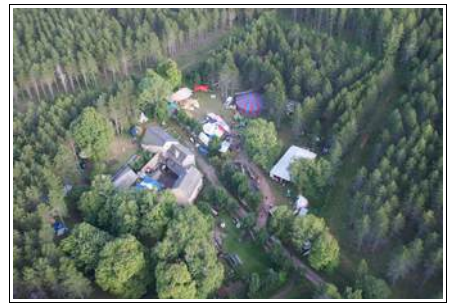
50 ans de Nature et Progrès